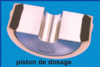
piston de dosage

De cette confrontation sont nés les produits-phares de l'entreprise, les pistons de dosage et les vannes à boisseaux coniques. La pertinence de ces technologies est universellement reconnue, l'existence de nombreux clones sur le marché en atteste, mais l'original EFJM est rarement égalé. Si les produits les plus prestigieux font notre notoriété, force est de constater que ce sont